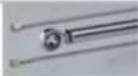
Modello con battente in legno