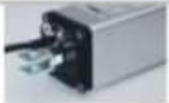
Modello con battente in metallo